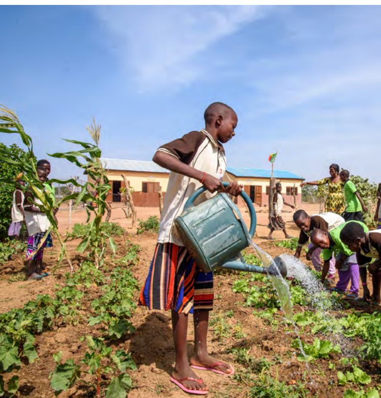
Jardin scolaire de production maraîchère pour les cantines scolaires.

Les relations entre agriculteurs et éleveurs seront un autre facteur qui recevra une attention particulière afin de réduire les risques de conflits intercommunautaires et de tensions ethniques ou de l'exploitation de ces tensions par des groupes liés à l'extrémisme violent. Au-delà des programmes de coopération sensibles au conflit, la Suisse mobilisera également ses outils de politique de paix et de prévention de la violence avec le programme de Prévention de l'Extrémisme Violent (PEV) de la DPDH et ses experts.