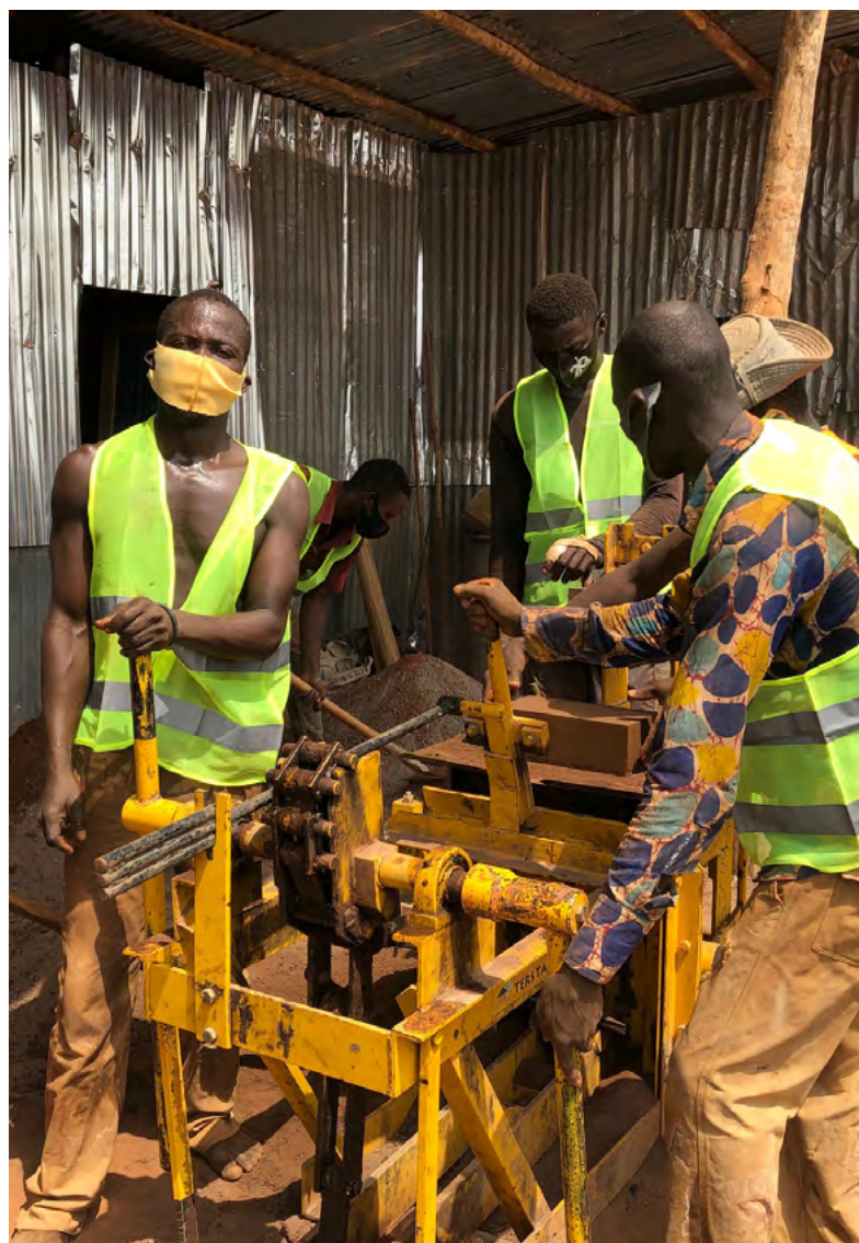
Fabrication de briques en terre compressée.

Des résultats particulièrement intéressants ont pu être réalisés dans la dynamisation de l'économie locale et de l'entrepreneuriat local : la construction de 50 infrastructures agropastorales et économiques marchandes a bénéficié à des milliers d'agriculteurs, d'éleveurs et de marchands ainsi que des dizaines de milliers d'utilisateurs. Le recours systématique à des matériaux et artisans locaux a stimulé les économies locales. Le marché international de Malanville, situé à la frontière avec le Niger au nord-est du pays, a par exemple accru ses recettes de 260 % depuis 2017 suite à sa réhabilitation