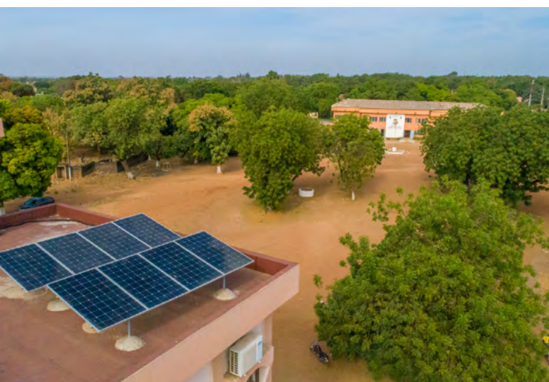
Panneaux solaires à la mairie de Kandji.

Apprentissages : Seul et unique instrument de décentralisation financière au Bénin, le FADeC apporte aux communes périphériques des ressources financières cruciales pour la réalisation des plans de développement communaux et le financement des services sociaux de base. L'intégration systématique des questions de gouvernance en tant que thème transversal dans le portefeuille du programme de coopération permet une meilleure durabilité des actions de la Suisse et la prise en compte des enjeux de la décentralisation dans toutes ses activités. On note cependant encore une faible prise de conscience et d'engagement de la société civile sur les aspects de paix et de sécurité. Le contexte législatif solide en terme d'égalité entre hommes et femmes peine également à se traduire en politiques et actions efficaces en raison