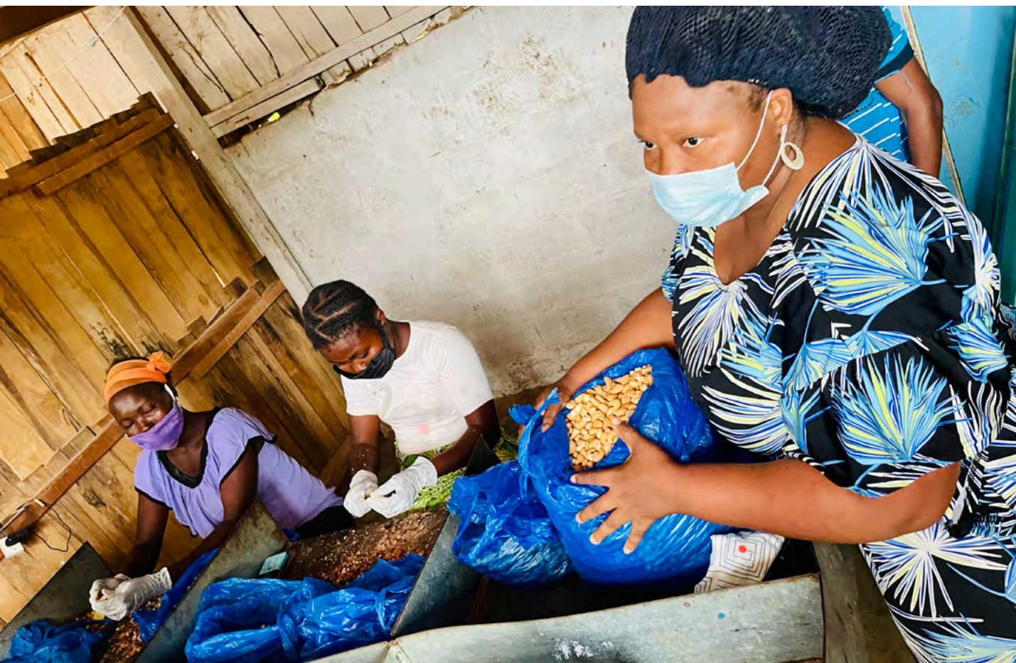
Transformatrices de noix de cajou à Parakou ; Photo : DDC/Ayouba Yaye

36,9 %, la croissance économique reste cependant peu inclusive, tandis que la très forte croissance démographique du pays (plus de 3 % par an) absorbe en partie les gains de ces dernières années. Le taux de croissance par habitant reste bas (en moyenne 1,5 % seulement sur la période 2008–2018), l'indice de développement humain est de l'ordre de 0,52 en 2019 (Bénin classé 163 ème ) et la couverture en protection sociale d'environ 8 %.