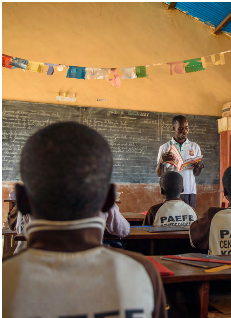
Education alternative dans un centre « Barka » à Gogounou

Grâce à son dialogue politique et son appui technique, la Suisse a influencé l'élaboration du plan sectoriel pour l'éducation au Bénin, qui inclut dans son dispositif les alternatives éducatives soutenues par la Suisse, afin d'offrir une éducation de base également aux enfants et adultes exclus du système. Les programmes d'alternatives éducatives mis en œuvre par la Suisse au Bénin ont touché ces cinq dernières années environ 10'000 enfants de 9 à 15 ans. Les programmes d'alphabétisation ont concerné environ 22'000 adultes et jeunes dont 58 % de femmes. L'appui à la scolarisation de plus de 6'000 jeunes filles a contribué à réduire les inégalités sociales de genre et à développer des bonnes pratiques désormais