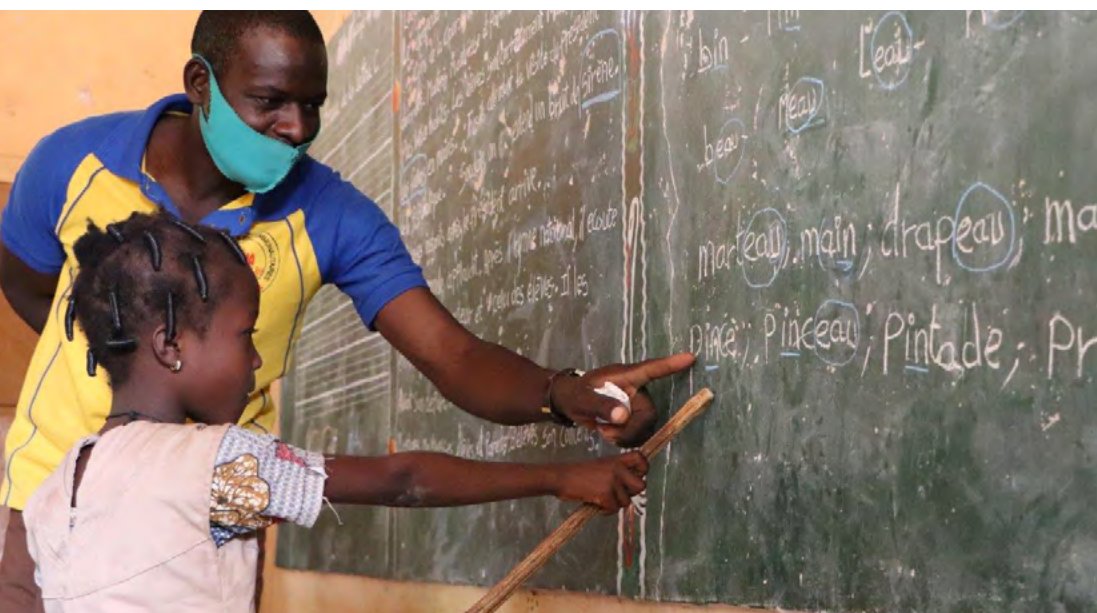
Gestion décentralisée de l'éducation de base.

Une analyse de risques liés aux partenaires est conduite systématiquement et les visites de terrain sont complétées par des comités de pilotage et des audits. Des revues et évaluations de programmes donnent des avis sur les résultats obtenus et les montages institutionnels choisis. Des capitalisations d'expérience et/ou des études d'impacts sont effectuées, dans la mesure du possible avec les conseillers et groupes thématiques régionaux de la Division Afrique de l'Ouest (DAO)