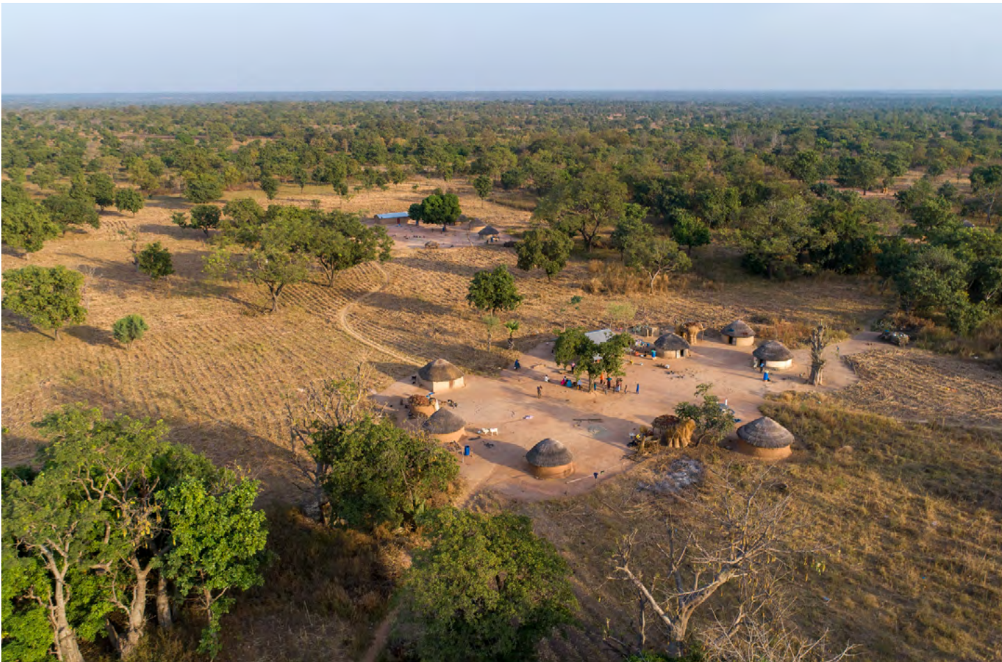
Campement Peulh.

ou les réseaux DDC, ainsi qu'avec les experts de la DPDH. Ceux-ci seront mis à contribution pour les moments forts des programmes pour y apporter une plus-value et renforcer la gestion institutionnelle du savoir. Enfin, l'engagement suisse est régulièrement suivi par le Gouvernement béninois et la communauté internationale à travers l'analyse des données de l'aide publique au développement au Bénin.