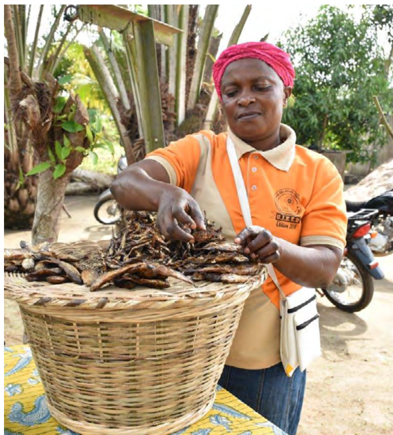
Vendeuse de poisson séché ; Photo : DDC

Le programme de coopération suisse au Bénin est construit sur le scénario intermédiaire tel que décrit dans l'annexe 2. Celui-ci considère une polarisation politique qui se poursuit, avec des espaces démocratiques réduits et une lutte renforcée contre la corruption. La croissance économique soutenue est alimentée par un meilleur climat pour les affaires et la capacité du Gouvernement à mobiliser des prêts sur le marché financier international. La cohésion sociale est affaiblie mais maintenue, malgré sa mise à l'épreuve par la menace grandissante de l'extrémisme violent et les conflits entre agriculteurs et éleveurs. Le Gouvernement parvient à mettre en œuvre, de manière progressive et sur l'ensemble de son territoire, les réformes prévues pour un développement durable et plus inclusif. Ce scénario mise également sur la capacité des acteurs du développement à maintenir des espaces de dialogue, d'influence et d'action avec le Gouvernement, ainsi que des soutiens à la société civile.