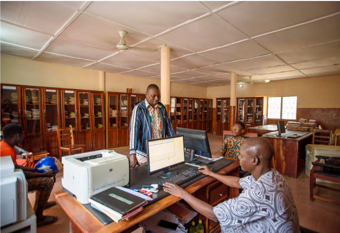
Salle d'archive à la mairie de Bembéréké.