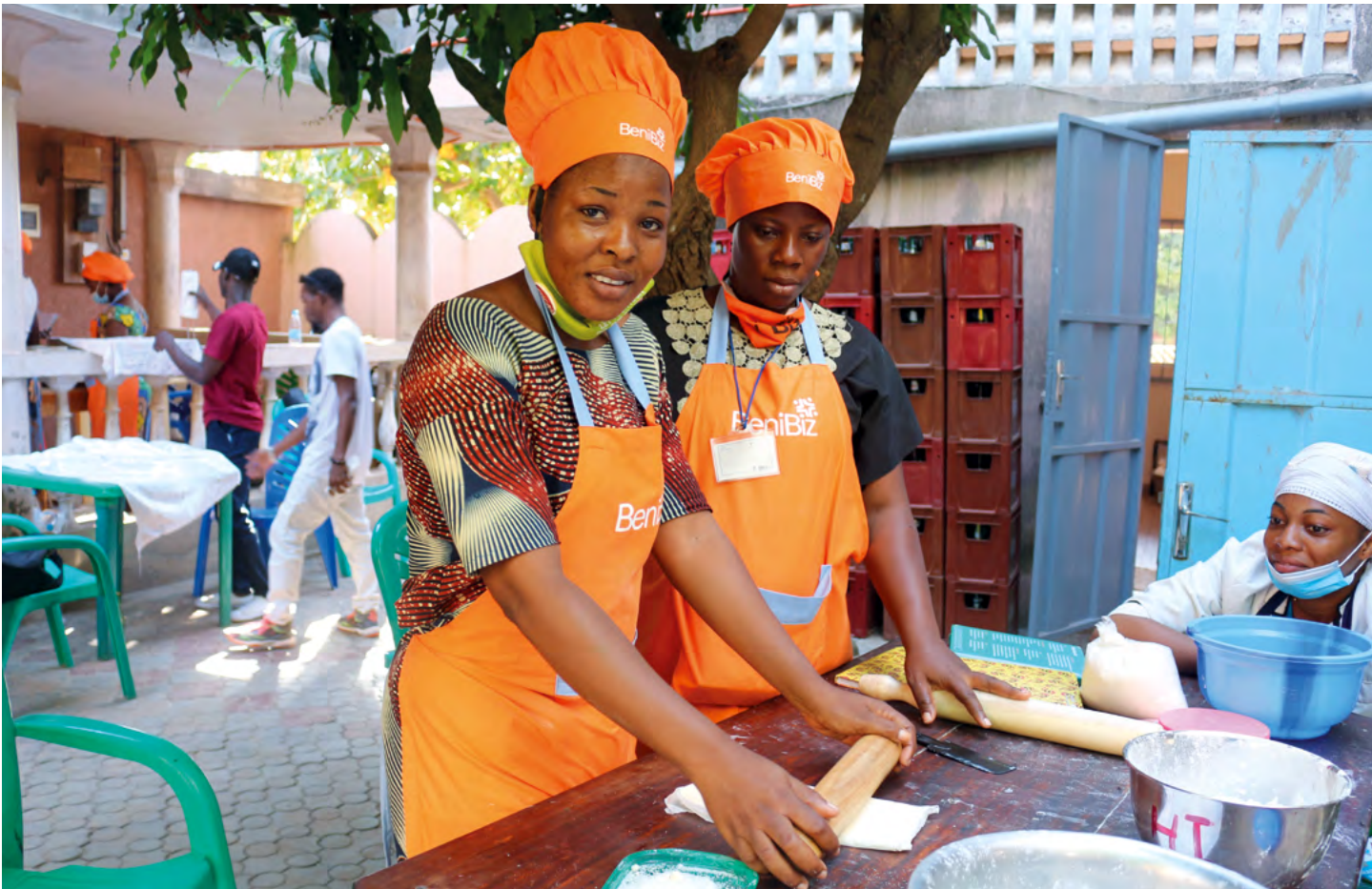
Formation en pâtisserie

risques de catastrophes sera assurée dans les programmes où elle est pertinente et des actions spécifiques ciblées seront envisagées au cas par cas, en appui à la politique nationale de gestion des changements climatiques récemment établie.